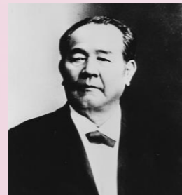
▲渋沢栄一