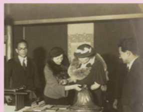
▲保己一の小さな像に親しげに触れているヘレン・ケラー