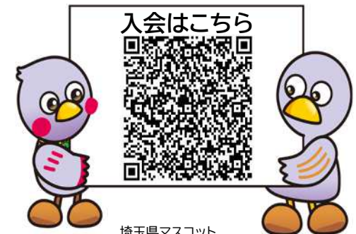
埼玉県マスコット 「さいたまっち」「コバトン」