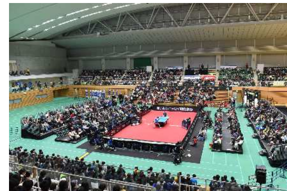
2018年12月23日 @ウィングハット春日部