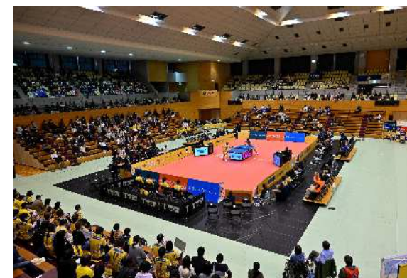
2023年11月18日 @越谷市立総合体育館