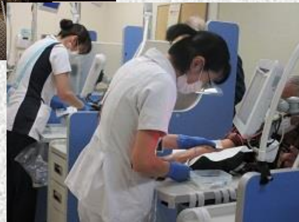
最前線で働く 看護師