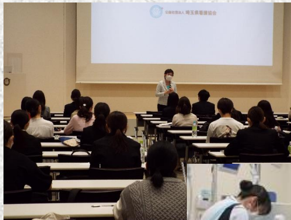
新人看護職員研修 の様子