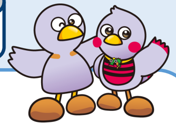
埼玉県マスコット「コバトン」「さいたまっち」