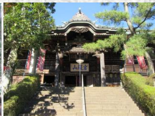
岩殿山 安楽寺 (吉見町)