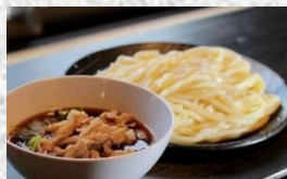
武蔵野うどん (西部地域)