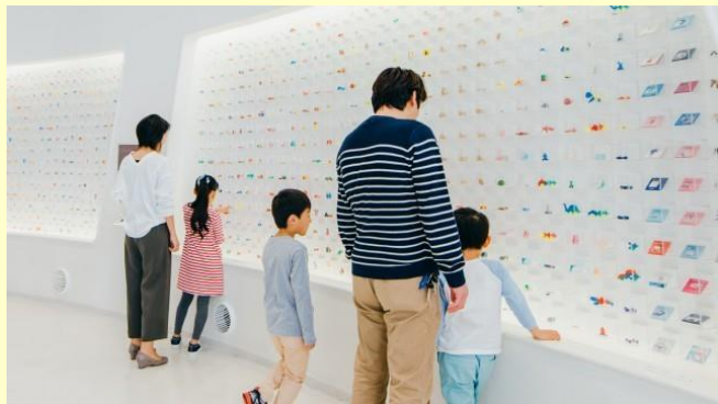
グリコピア・イースト(北本市)