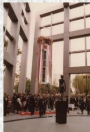
開館記念式典 1982年11月2日