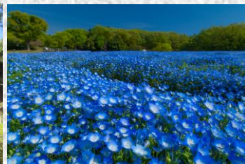
国営武蔵丘陵森林公園 (滑川町)