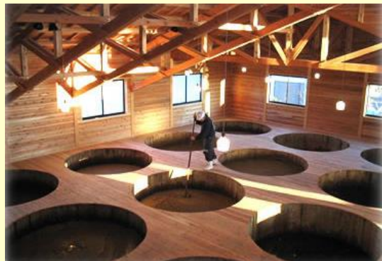
弓削多醤油(坂戸市)