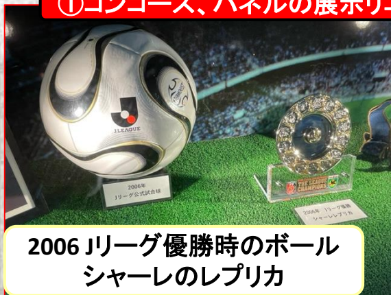
2006 Jリーグ優勝時のボール シャーレのレプリカ