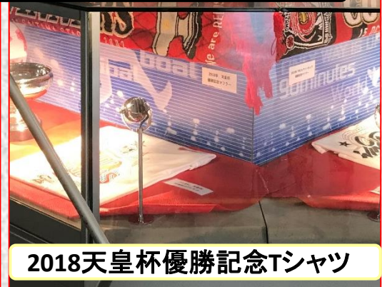
2018天皇杯優勝記念Tシャツ