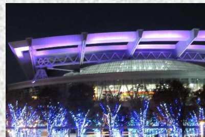
さいたまスーパーアリーナ