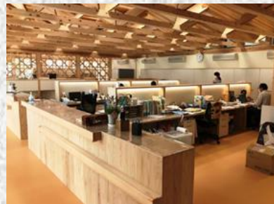
県産木材を活用した民間施設の事例(飯能商工会議所)