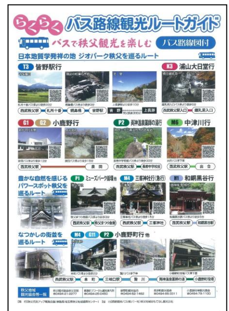
バス路線観光ルートガイド

バスやタクシーによる二次交通を補完するため、平成26年8月からレンタサイクルを開始しました（自転車110台、サイクルステーション6ヶ所）。