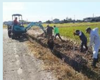
地域住民による水路の草刈

自然環境の保全や良好な景観の形成など、多面的機能を有する農地や農業用水路などは県民共有の財産です。しかし、これらの維持・保全を農業者だけで担うことは難しくなってきました。 当センターでは水路の泥上げや草刈り等の共同活動が交付対象となる「農地維持支払」や、施設の長寿命化や地域の景観形成、地域住民との交流などの普及・啓発活動が交付対象となる「資源向上支払」等の資金援助により、地域の活動を支援しています。 新たに地域活動を取り組みたい、地域の活動を広げたい等ありましたら、農村整備部整備支援・管理担当までご相談ください。