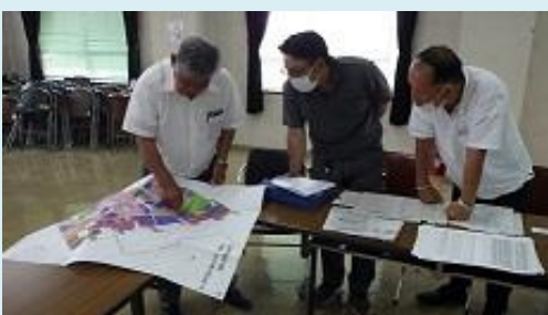
再配分会議で農地の集積・集約を検討

管内では、担い手への農地の集積・集約化の取組を積極的に進めています。関係機関が強力に連携して事業推進を行い、県全体の実施（転貸）面積の約4割（4,675ha：令和5年度末）を占める県内一の先進地です。