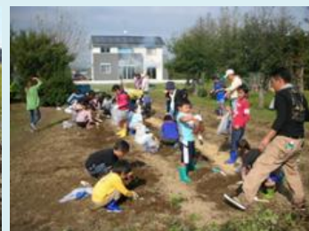
子供会と芋ほり体験