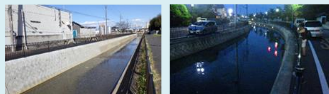
整備工事が完了した「会の川」

埼玉県では、県民誰もが川に愛着を持ち、ふるさとを実感できる「川の国埼玉」を実現するため「川の再生」に取り組んでいます。 令和3年度からは「水辺周辺活用事業（農業用水）」として、会の川地区（加須市）、ヘルシー・ふれあい地区（行田市、加須市、鴻巣市）において、水路整備や歩道等の整備を実施しています。