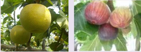
加須市産の「なし」と「いちじく」

梨の栽培が盛んで、共同選果施設を活用した市場出荷に加え、直売など地場流通にも積極的に取り組んでいます。幸水、豊水の主力品種に加え、埼玉県が育成した「彩玉」も栽培されています。 また、いちじくの栽培も盛んで県内屈指の産地です。