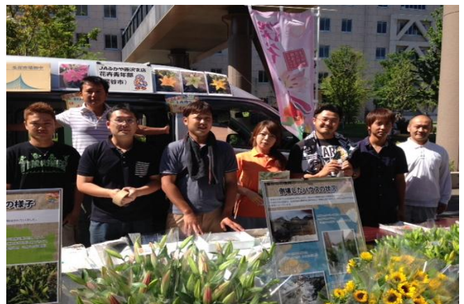
県庁朝市での販売促進活動

2月の大雪で施設倒壊など大きな被害を受けた深谷地区では、産地の一日も早い復興に向けて若手生産者が中心となって、消費者などへ産地のPRに関する活動を行っています。