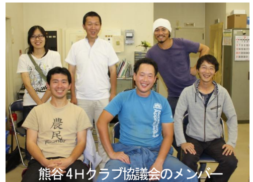
熊谷4Hクラブ協議会のメンバー

現会員は6人で、仲間達と一緒に和気あいあいと活動に取り組んでいます。今年も新たな仲間を募り、さらに活動の幅を広げたいと考えています。今後の活躍にご期待ください。