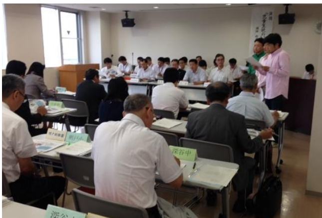
深谷市校長会でのプレゼンテーションの様子

今後もあらゆる機会を捉え、お客様のニーズを把握し、積極的に販促活動を行いたいとのことでした。