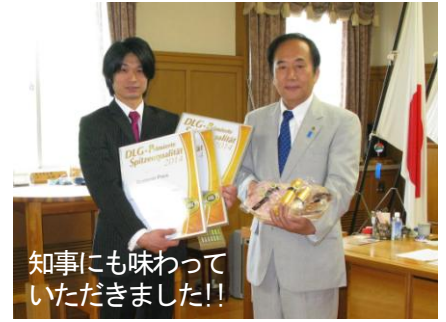
知事にも味わっていただきました!!