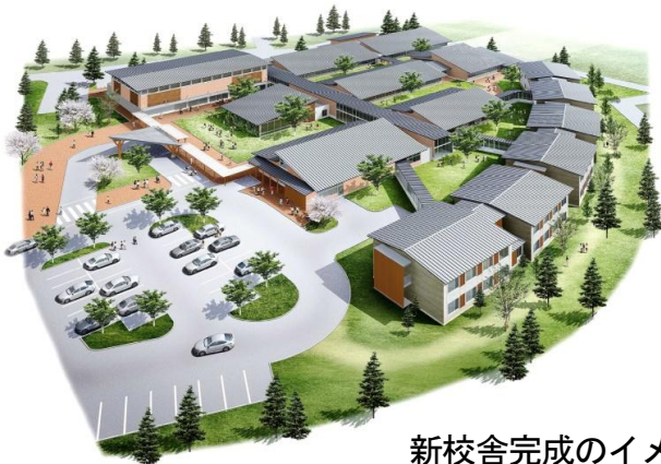
新校舎完成のイメージ

埼玉県農業大学校は農業及び農業関連産業の担い手を育てるための埼玉県立の専修学校です。農業大学校は昭和20年に埼玉県農民道場として設立して以来鶴ヶ島にありますが、平成27年4月に熊谷市樋春に移転することになりました。