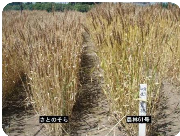
左：「さとのそら」 右：「農林61号」