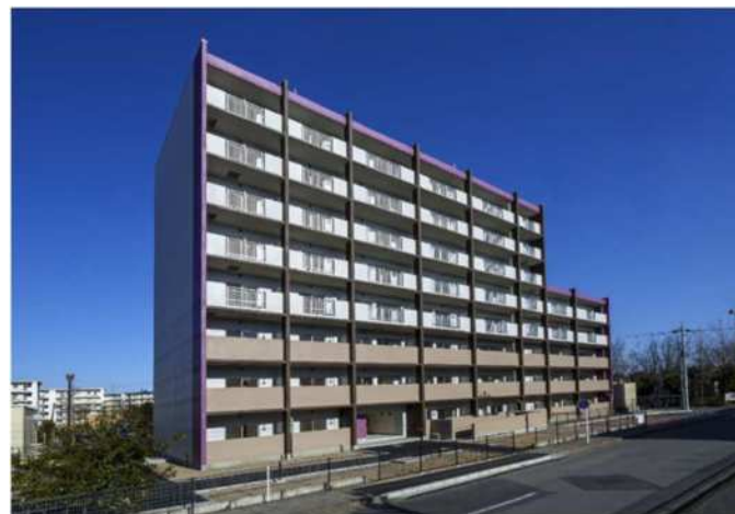
県営久喜青葉団地 建替工事