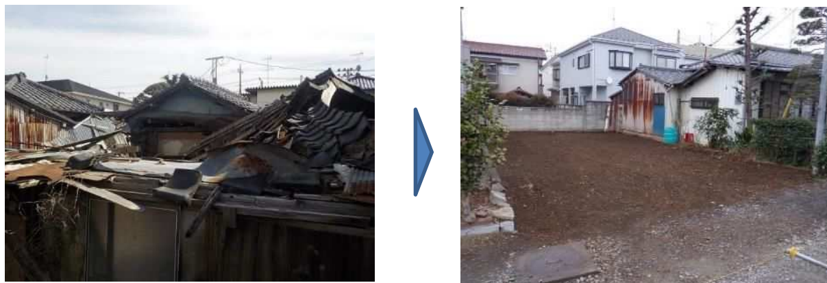
東松山市空き家除却事業