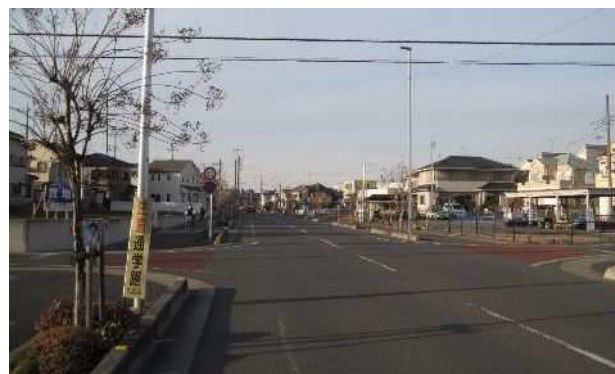
桶川市下日出谷東ほか2団地 市街地基盤整備事業