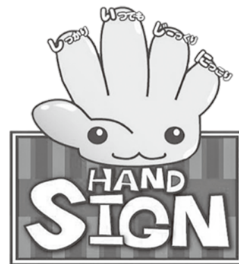
道路横断時の安全行動イメージキャラクター 「サイン(SIGN)ちゃん」