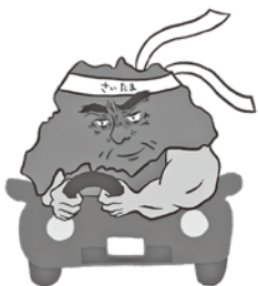
歩行者優先 イメージキャラクター 「さいたまお父さん」

統一行動日とは、関係機関・関係団体が連携を図り、一斉に交通事故防止の啓発に努める日のことです。