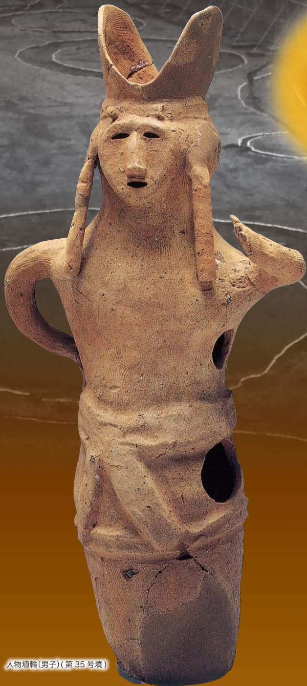
人物埴輪(男子)(第35号墳)