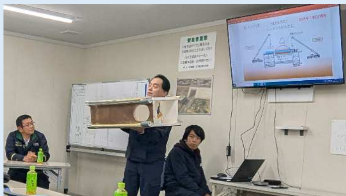
JV手作り模型も使って工法説明

施工開始から概ね2年が経過し、新しい阿須ガードの構築が順調に進んでいます。引き続き、地元の皆様の御理解と御協力を頂きながら、安全第一で工事を進めてまいります。