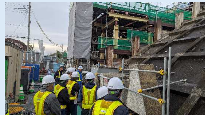
もとの阿須ガードから切り出したコンクリートを見学