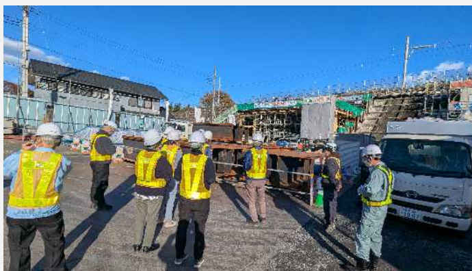
新しい阿須ガードを構成する部材を見学