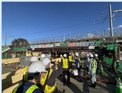
作業構台にも上って見学しました

今後もJV、JR、県の3者で協力して事業を進めていく中で、現場状況を踏まえながら現場を見学していただく機会を設ける予定です。