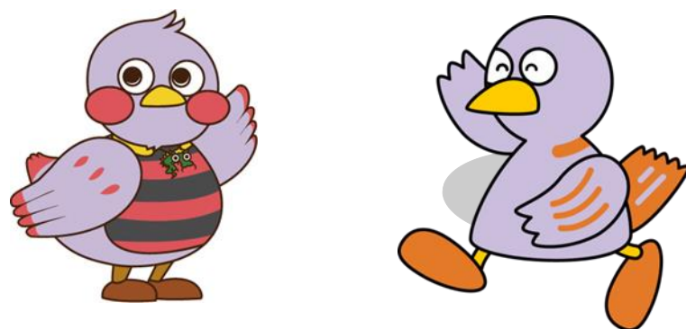
埼玉県マスコット 「さいたまっち」「コバトン」