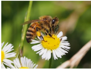
Apis mellifera ※セイヨウミツバチの学名

学名とは、世界共通で用いられる名前です。言語の異なる地域間でも同じ生きものを示すことができるため、学術的な場面で使われます。ラテン語が用いられ、「二名法」と呼ばれる方法で表されます。また、他の単語と区別できるように斜体で記述します。