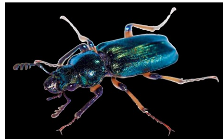
チチブコルリクワガタ