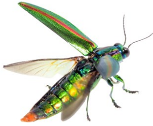
タマムシ (ヤマトタマムシ) ※「玉」 (=宝石) のように美しいためタマムシ (玉虫) と付いた。