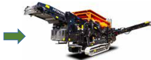
用途に応じて自走式スクリーンによる篩い分け