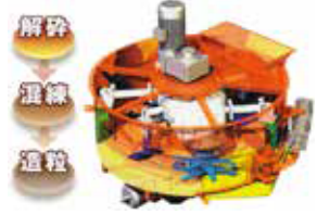
高性能造粒ミキサー「ベレガイア」