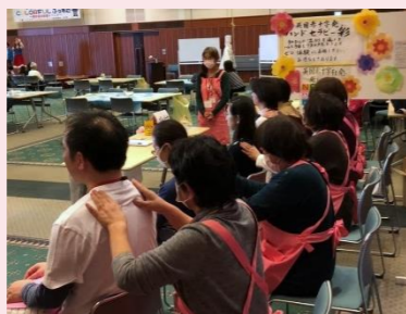
川口市COLORFUL(カラフル)ふえすた

「ハンドセラピー養成講座」「地域ふれあい講座」「こころのふれあい講座」の講習会を通して、学んだ知識と技術を活かし、日常生活でのコミュニケーションをとるツールとしてケア施設への訪問・イベント参加などへの地域でのボランティア活動を支援しています。