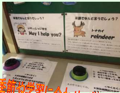
季節や学習に合わせて単語を選定