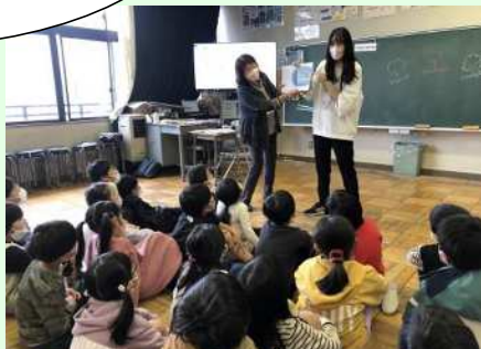
ALTによる読み聞かせ