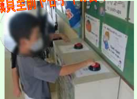
職員室前や各学年の廊下に設置