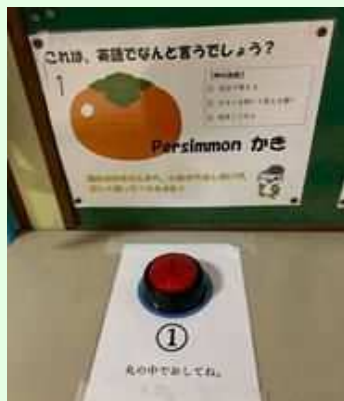
音声が入るボタン

季節や各学年に合わせた単語などにすることで、多くの児童がボタンを押す、発音している。