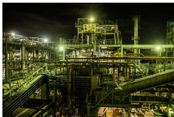
タイトル：昼夜活動の要 撮影場所：新河岸川水循環センター