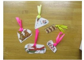
【図書委員による集計やしおりのプレゼント】