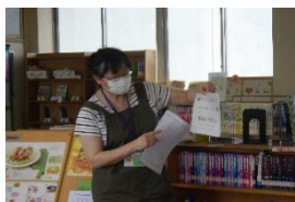
「学校司書による授業」