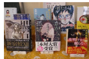
「職員おすすめの本の展示」