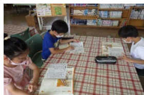
「日本十進分類法の学習」