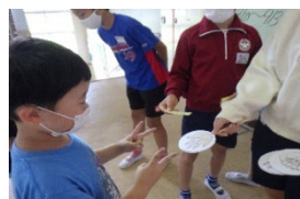
「じゃんけんの様子」