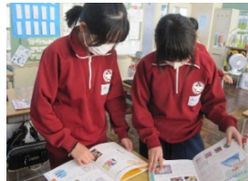
「探究学習での活用」