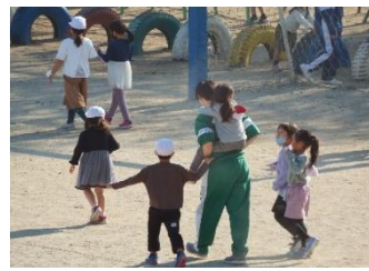
新座総合技術高等学校の 小中学校との交流体験