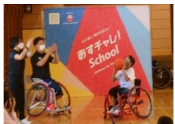
第四小学校の車いす バスケットボール体験