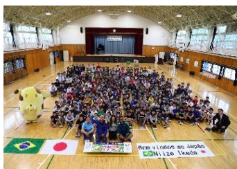
池田小学校の ブラジル選手との交流