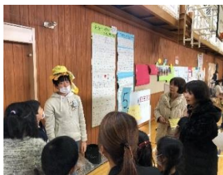
片山小学校の地域防災会議