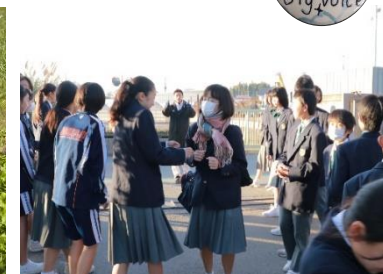
第三中学校のあいさつ運動