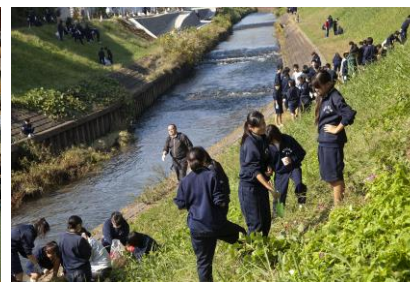
黒目川クリーン作戦