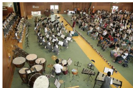
三中校区ふれあいフェスティバル