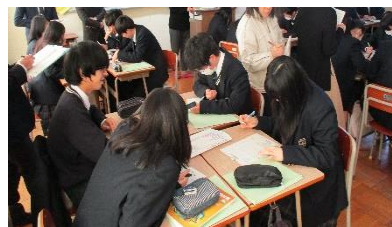
新座高等学校のペア学習