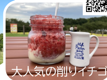
大人気の削りイチゴ