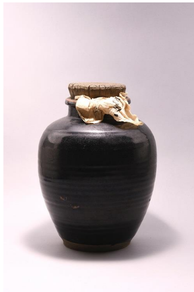
お茶を保管する道具 ④ 茶壺（当館蔵）