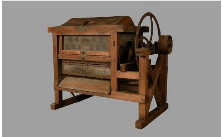
製茶機械の祖 高林謙三ゆかりの資料 ② 高林式粗揉機（当館蔵）