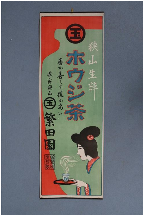
お茶をいかがですか ① 繁田園ポスター（当館蔵）