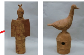
いろいろな埴輪が見られます。