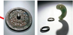
鉄剣以外にもいろいろな国宝があります。