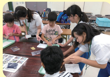
職場体験学習やボランティア活動を 受け付けています。