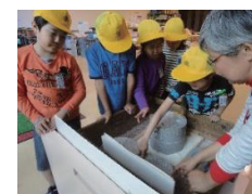
昔の道具体験の様子