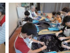
藍染め体験の様子