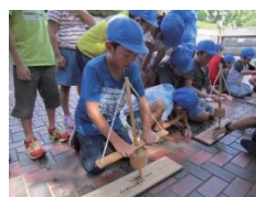
火おこし体験の様子