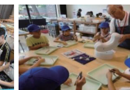
まが玉作りの様子