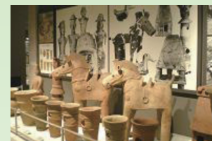
原始・古代展示室

《原始・古代》川越のあけぼの 入間川流域や仙波台地での発掘調査に基づいて、縄文時代から古墳時代にかけての社会の様相を展示。