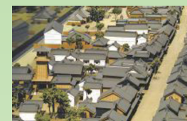
蔵造りの町並み復元模型

城下町から近代都市への発展を、川越大火と蔵造りの町並み、産業の振興を中心に展示。テーマで展示。