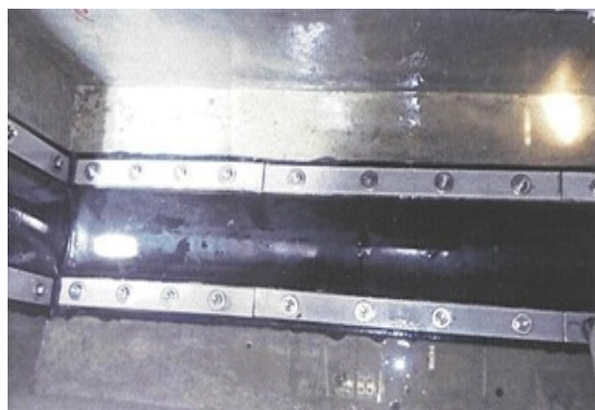
耐震補強工事事例【目地部】