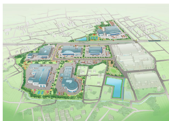
寄居桜沢地区完成予想図