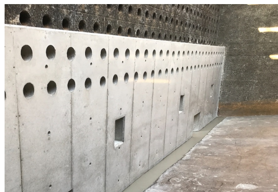
耐震補強工事事例【壁面部】