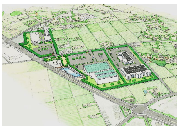
羽生上岩瀬地区完成予想図