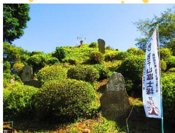
田子山富士塚（志木市）