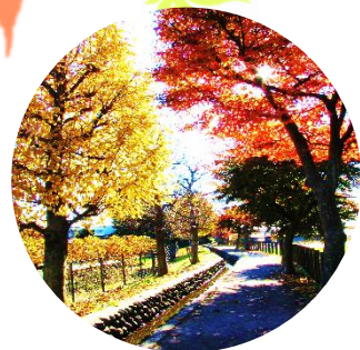
野火止用水 (新座市)