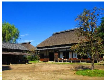
難波田城公園（富士見市）