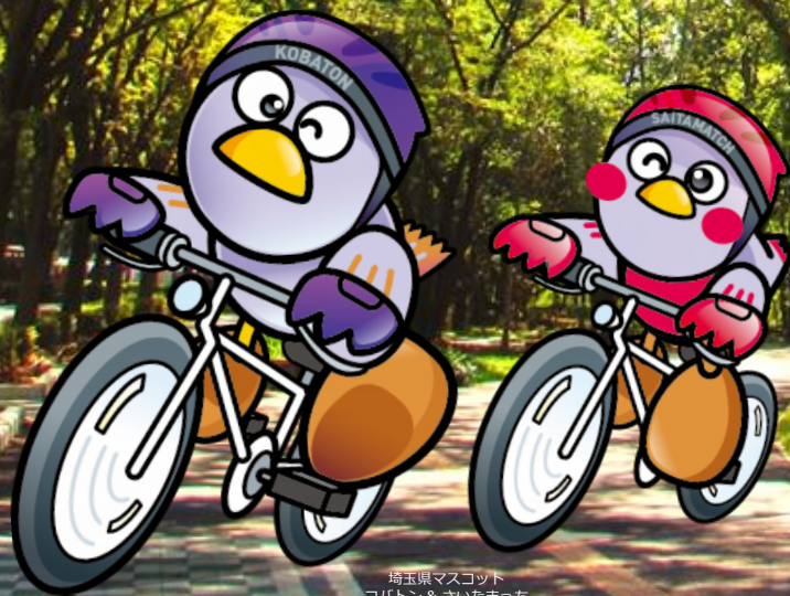
埼玉県マスコット コバトン & さいたまっち