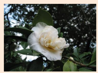
ツバキ・白太神楽(C19)