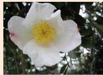
サザンカ・花の雪(C27)