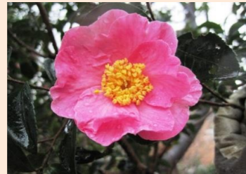
サザンカ・桃園錦(C6)