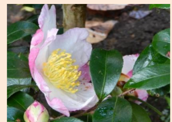
サザンカ・春雨錦(C21)