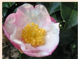
サザンカ・明石湯(C6)