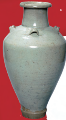
東松山市 光福寺宝篋印塔出土 白磁四耳甕 (光福寺蔵) 埼玉県指定文化財