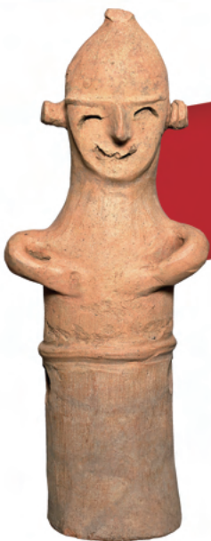
伝・本庄市 生野山出土 「笑う埴輪」 (さきたま史跡の博物館蔵) 埼玉県指定文化財