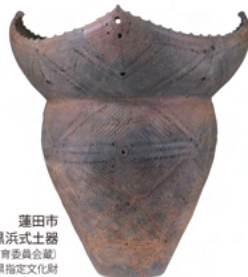
蓮田市 黒浜貝塚群出土黒浜式土器 (蓮田市教育委員会蔵) 埼玉県指定文化財

休館日▶月曜日(ただし11月1日、22日は開館) 時間▶9:00~16:30(観覧受付は16:00まで) 観覧料▶一般600円、高校生・学生300円 常設展観覧料を含む 中学生以下、障害者手帳等をお持ちの方(付添1名)は無料 「ぐるっとパス2021」で観覧できます