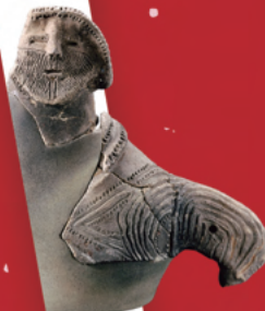
熊谷市 池上遺跡出土 土偶形容器 (埼玉県教育委員会蔵) 埼玉県指定文化財