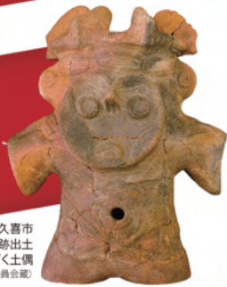
久喜市 小林八束1遺跡出土 みみづく土偶 (埼玉県教育委員会蔵)