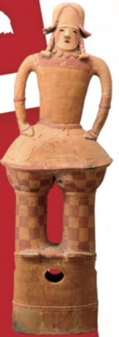
鴻巣市 生田塚埴輪窯跡出土 人物埴輪 (鴻巣市教育委員会蔵) 重要文化財