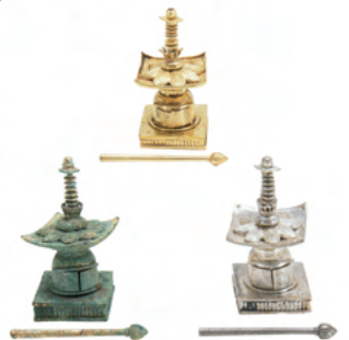
美里町 広木上宿遺跡出土小型宝塔 (埼玉県教育委員会蔵) 埼玉県指定文化財