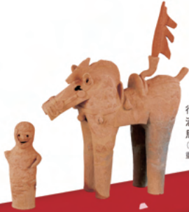
行田市 酒巻14号墳出土 馬形埴輪・人物埴輪(馬曳ぎ) (行田市郷土博物館蔵) 重要文化財