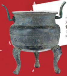
上里町 大光寺裏遺跡出土 青銅製香炉 (埼玉県教育委員会蔵) 埼玉県指定文化財