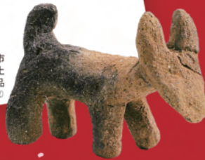
加須市 長竹遺跡出土 犬形土製品 (埼玉県教育委員会蔵)