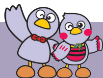
埼玉県マスコット コバトン&さいたまっちゃん

新型コロナウイルス感染症拡大の影響により中止や内容変更となった場合には、 With You さいたまホームページ及びFacebookでお知らせします。 講座中は換気を定期的に行い、密集・密接にならないよう室内環境を整えてまいります。 参加する皆様には館内でのマスク着用をお願いします。