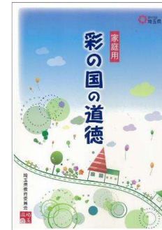
家庭用「彩の国の道徳」