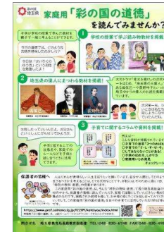
保護者用リーフレット