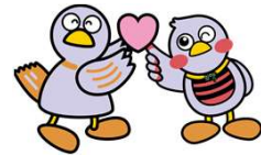
埼玉県マスコット「コバトン」「さいたまっち」