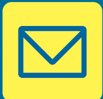
メールアドレス (パソコンで使用可能なもの)