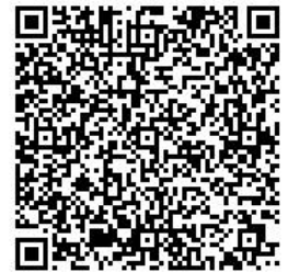
QRコードは(株)デンソー ウェブの登録商標です。