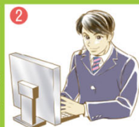
2 ネットパトロール