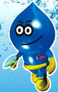
けんえいすいどう 県営水道マスコット ウォー太郎