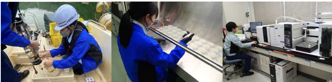
げんば すいしつけんさ ▲現場での水質検査