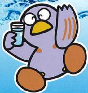
さいたまけん 埼玉県マスコット コバトン