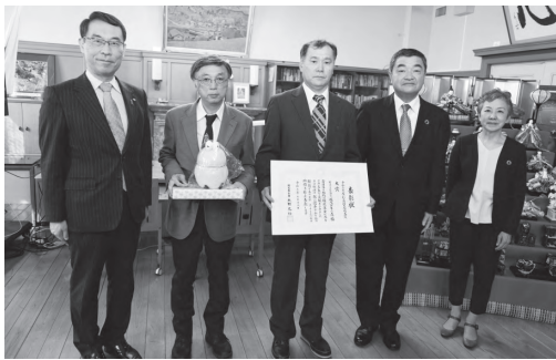
県民部門 大賞受賞 特定非営利活動法人 秩父百年の森