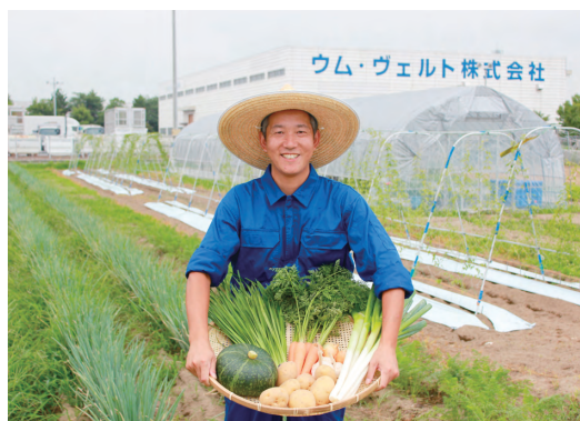
食品リサイクルをコア事業とした地方創生計画