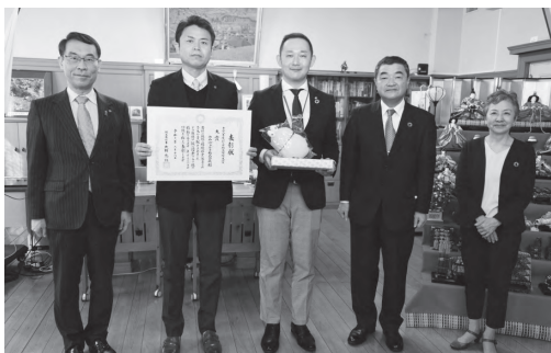
事業者部門 大賞受賞 ウム・ヴェルト株式会社