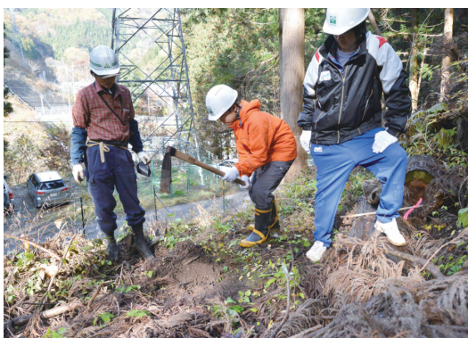
山・里・街が連携した未来へつなく森づくり