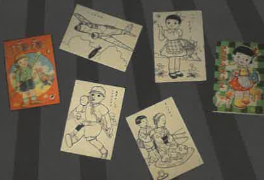
ナカヨシヌリエ 男ノ子・女ノ子