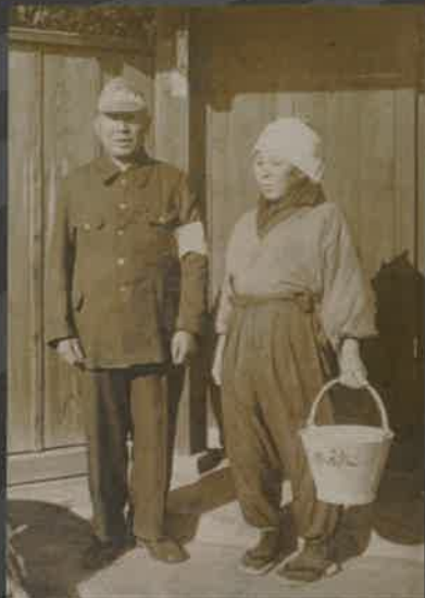
国民服とモンペ服の男女

埼玉県平和資料館では、開館以来、戦争の悲惨さと平和の尊さを後世に伝えるために、先の大戦に関する資料や戦前期から戦後期までの生活用具などの、調査・収集・保存・展示を続けてきました。