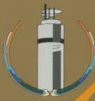
埼玉ピースミュージアム (展望塔が目印です)

※会期中のイベントは、新型コロナウイルス感染症予防のため、例年どおりの開催時期に行えない場合があります。イベントの記事や詳細については、HPに掲載しますので、事前にご確認ください。