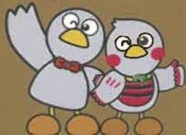
埼玉県マスコット コバトン・さいたまっち