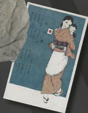
慰問用国民歌 絵葉書