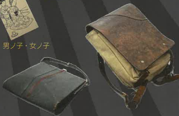
鉸皮製ハンドバッグと布製ランドセル