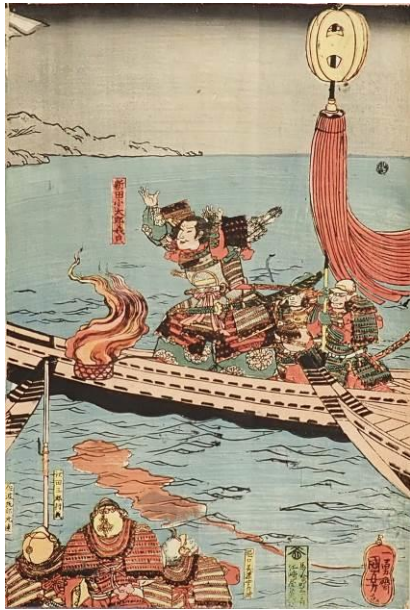
鎌倉侵攻へ大手をかける新田義貞 ⑨埼玉県指定文化財 小室家資料のうち 歌川国芳画「稲村ヶ崎海戦之図」 (部分) (埼玉県立文書館蔵)