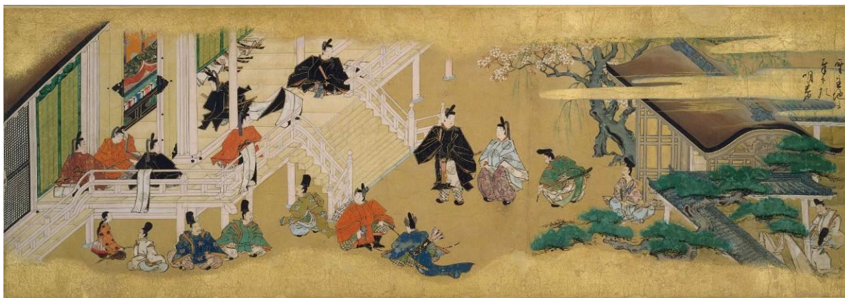
ごだいごてんのう 後醍醐天皇の即位