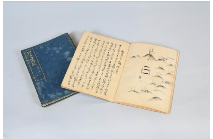
『太平記』の絵入り解説書