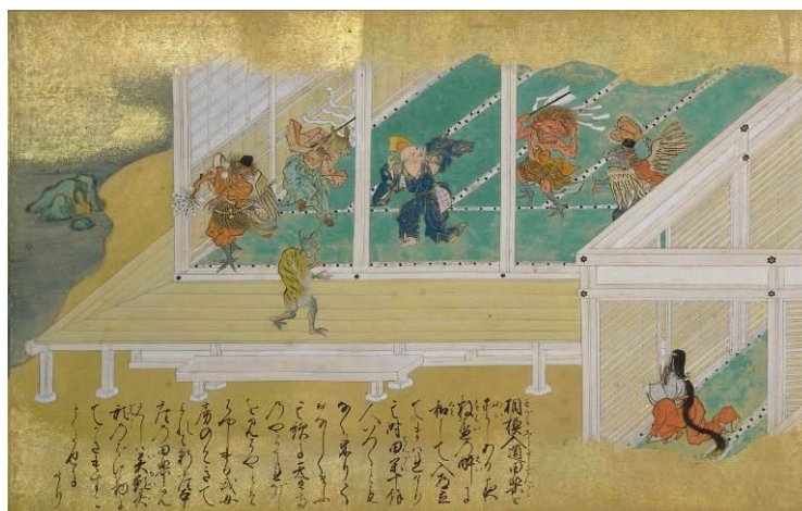
でんがく 異類の者と田楽に興じる北条高時