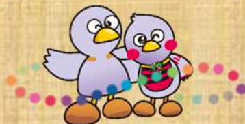
埼玉県マスコット 「コバトン」&「さいたまっち」