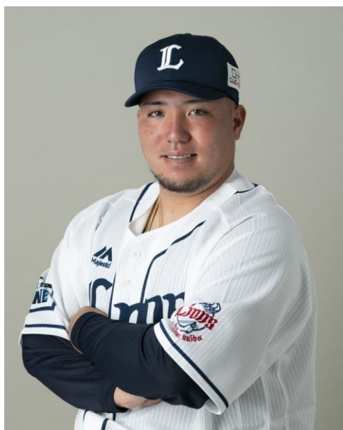
山川 穂高 選手

※埼玉西武ライオンズは、平成28年6月に包括的連携協定を結んでおり、県と企業がそれぞれの得意分野を生かして、地域の活性化や県民サービスの向上に貢献するための仕組みづくりをしています。