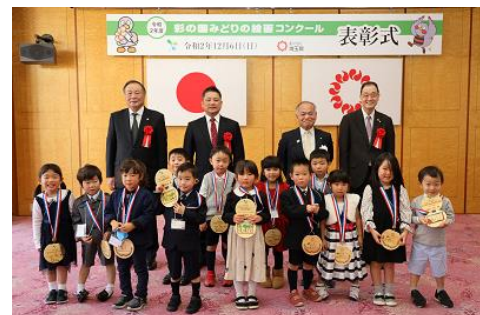
昨年度の表彰式の様子