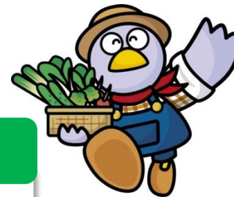
埼玉県のマスコット 「コバトン」

農業近代化資金は、意欲ある農業者の皆様を経営面からバックアップする資金です。 あなたの疑問にコバトンがお答えします！