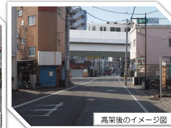
高架後のイメージ図