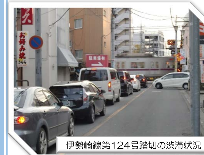
伊勢崎線第124号踏切の渋滞状況