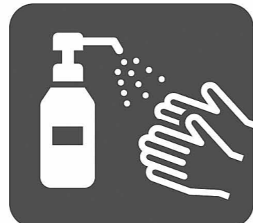
アルコール消毒液の設置