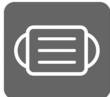
マスク着用 (咳エチケット)