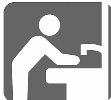
来場前後の手洗い