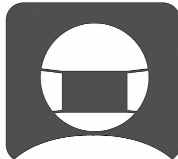
スタッフのマスク着用