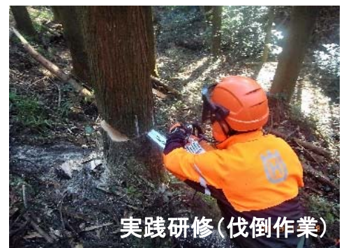
実践研修(伐倒作業)