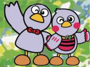
埼玉県マスコット 「ロボトン」「さいたまっち」