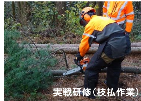
実戦研修(枝払作業)