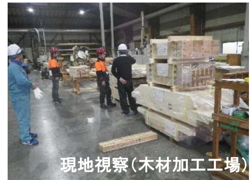
現地視察(木材加工工場)