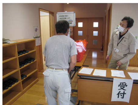
検温による感染防止対策の実施（鳩山町）