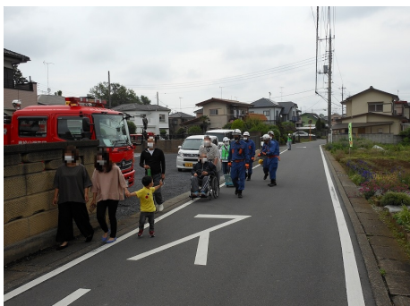
避難の実施（東松山市）