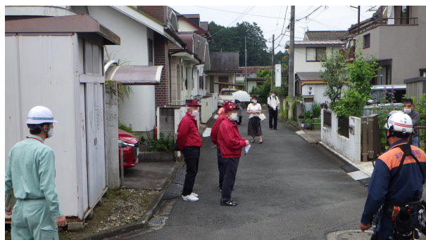
避難行動の確認（坂戸市）