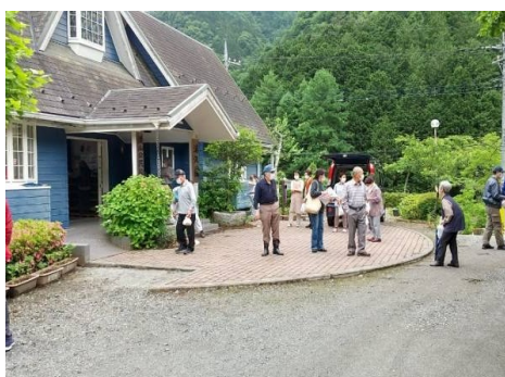
避難所への避難（秩父市）